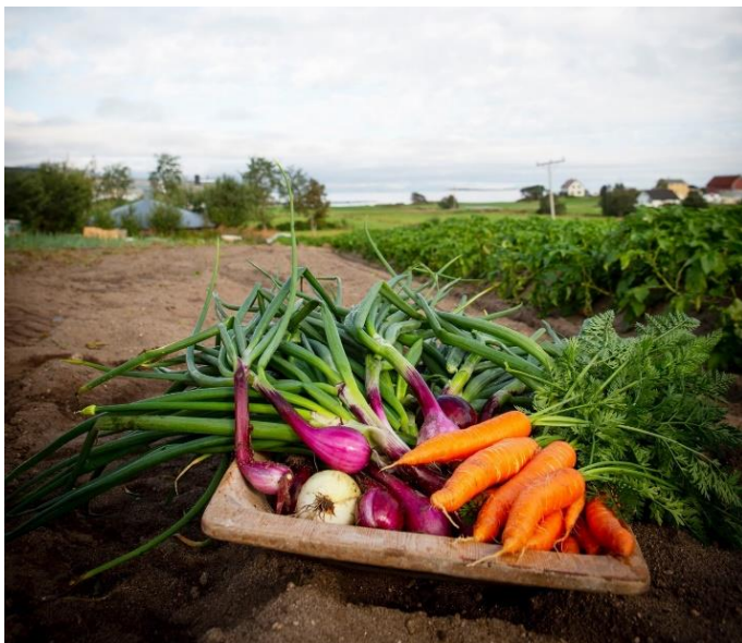
Grønnsaksproduksjon i Kvæfjord, Elde gård.

Arbeidet med planen bygger på FNs bærekraftsmål. Gjennomgående i planen, og for alle våre satsingsområder, skal også folkehelse, et aldersvennlig og universelt utformet samfunn, og klima og miljø, gjenspeiles.