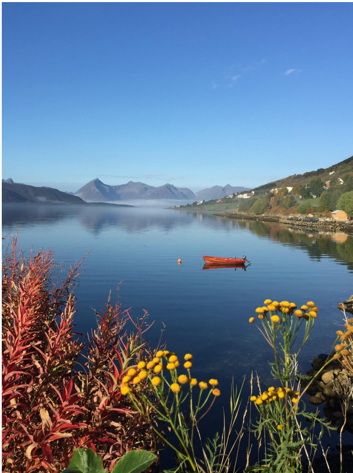
Utsikt mot Godfjordalpen.