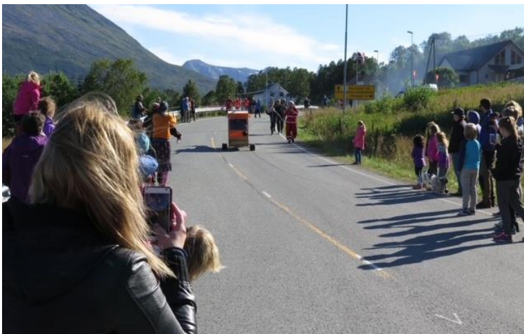
Olabil-løp under festivalen «Flesnes i fest».

Medvirkning med innbyggere skal være en forutsetning for våre tjenester. Som organisasjon, arbeidsgiver og tjenesteyter skal samhandling prege vårt arbeid og hvordan vi løser oppgaver i kommunen i årene som kommer.