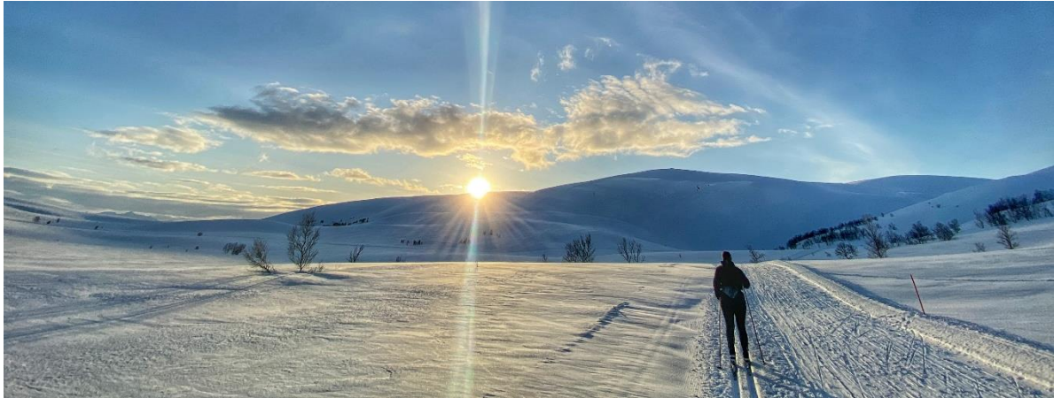
Kvæfjordeidet og Koven.