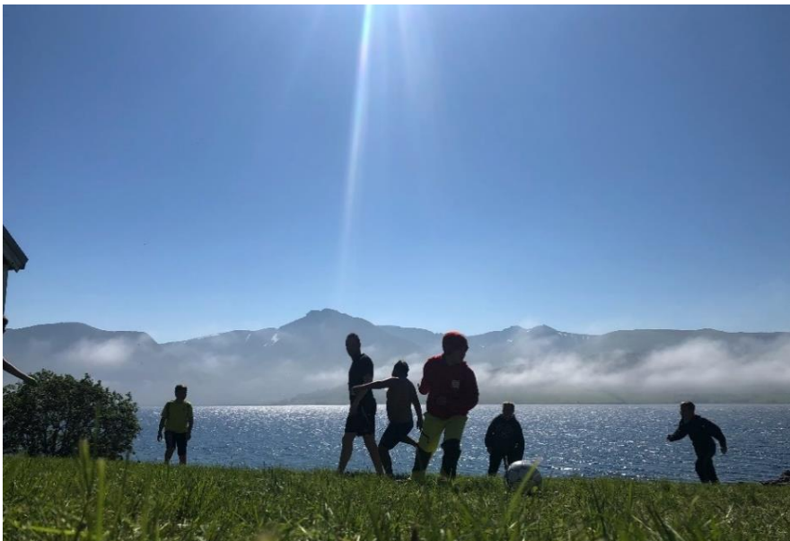
Sommerdag ved Bygdetunet.

Vi skal fortsatt levere så gode tjenester til innbyggerne at vi kan bestå som Kvæfjord kommune. Men vi vil også være tydelige på hva vi ønsker for fremtiden i kommunen vår, og hvordan vi vil utvikle Kvæfjordsamfunnet.