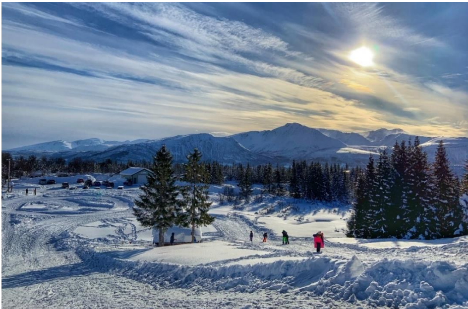
Aking ved Skytterbanen.