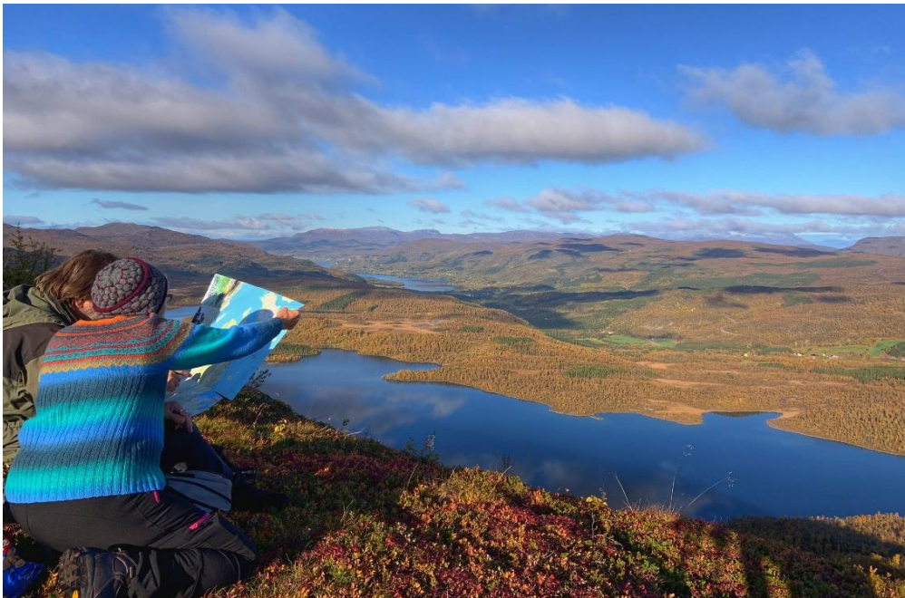
Stakketind/Steinfjellet. Fotograf: Hanne Thin Markussen

Vi har tro på at god stedsutvikling innebærer bærekraftig og miljøvennlig arealbruk og en bevisst holdning til et steds identitet og historie. En god stedsutvikling vil også være positivt for næringsutviklingen. Et godt tilbud på kommunale tjenester som skole, barnehage, helsetilbud og kultur- og aktivitetstilbud, og utvikling av gode bomiljø, legger til rette for næringsutvikling, bolyst og tilgang på kvalifiserte arbeidstakere.