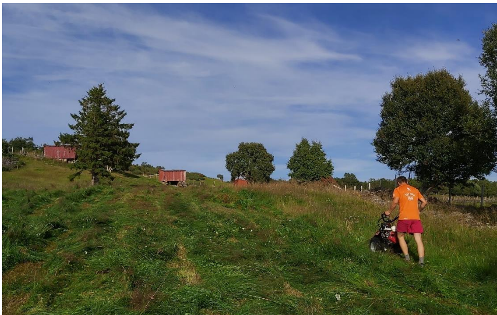
Slåttelandskap og utvalgte kulturlandskap ved Skallan/Rå.

Mål 17: Styrke virkemidlene som trengs for å gjennomføre arbeidet, og fornye globale partnerskap for bærekraftig utvikling